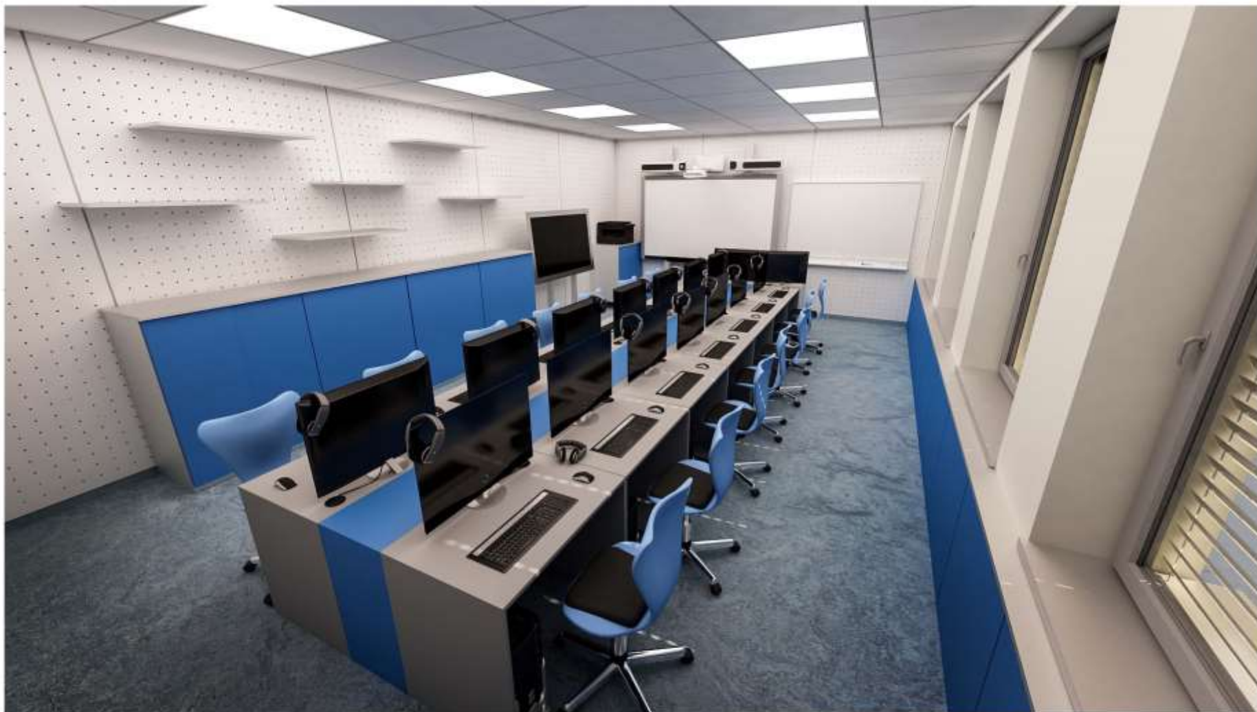
Vizualizace Centrum interaktivní výuky Stacionární digitální učebna - pohled A