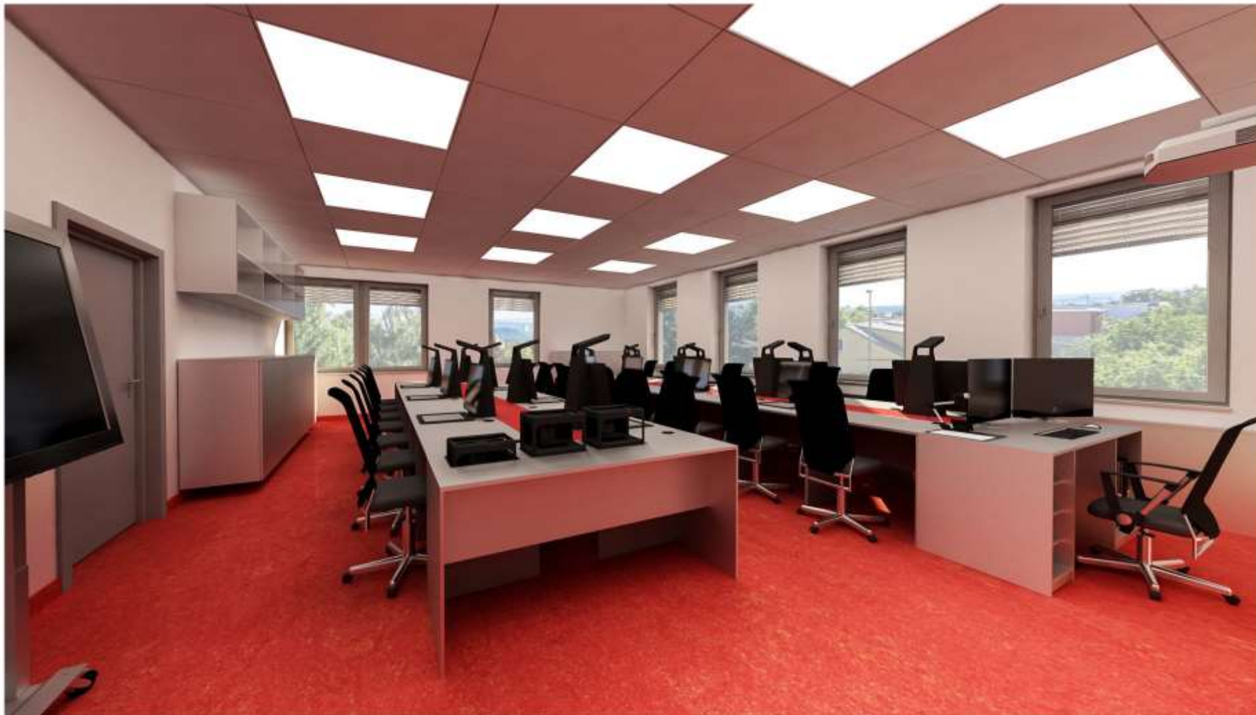
Vizualizace Centrum interaktivní výuky Odborná 3D učebna - pohled A